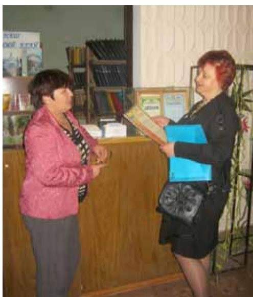
БЖД населення НМЦ ЦЗ та БЖД Рівненської області.

Серед заходів: проведення відкритого уроку з теми „Дії населення в надзвичайних ситуаціях техногенного та природного ха-